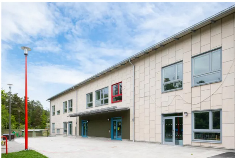
Förskolan Den röda tråden i Farsta. SISAB.

Pressmeddelande • Sep 20, 2019 13:55 CEST